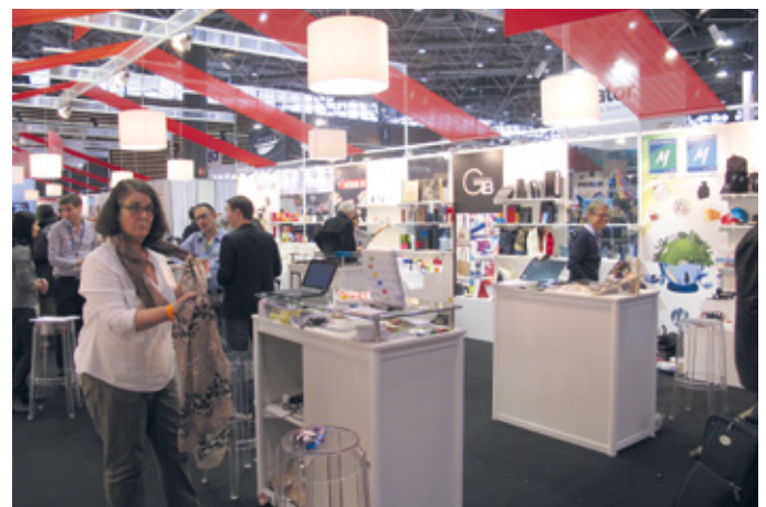
Der Stand der französischen Lieferantengruppe Les Spécialistes zog viele Interessierte an.