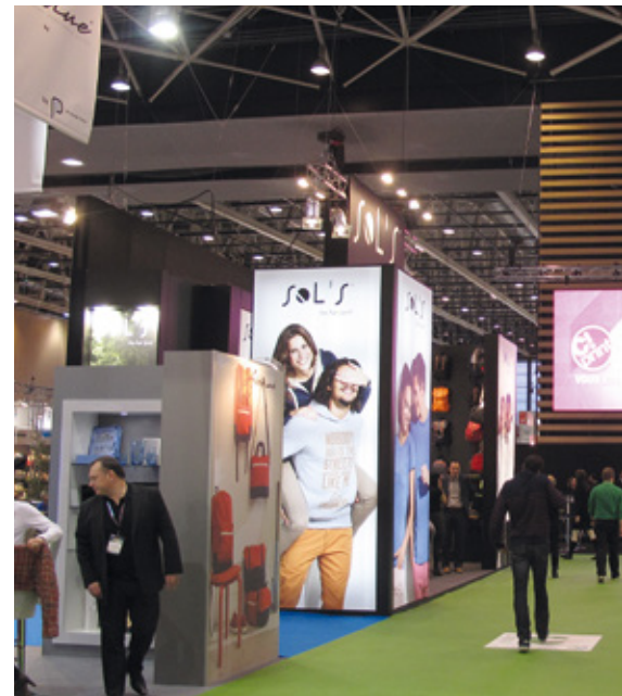
Textilien waren wie immer einer der großen Schwerpunkte der CTCO.